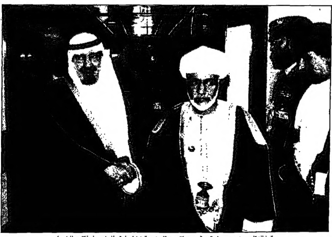
السلطان قابوس بن سعيد مع ولي العهد الامير حماد بن عبد العزيز في القرماء لمطرح جلسة الامس

القدس - من خلال مطمة: وقد انعقدت القمة الخليجية في ابوظبي في 17 كانون الأول (ديسمبر) 1998، والتي حضرها قادة دول الخليج الستة، من أهم الأحداث في العلاقات الدولية في المنطقة الخليجية.